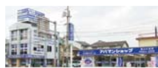
アバマンショップネットワーク加盟店 アバマンショップ福山三吉店

不動産にかかわる様々なことを、ご相談いただけます。 オーナー様と同じ視点からみた最適な提案をさせていただきます。 その他、ファイナンシャルプランニング、不動産投資、不動産投資分 析まで、幅広いコンサルティングを提供いたします。