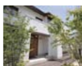
神辺展示場 モデルハウス

暮らし継がれる本物の住まい 長期優良住宅プラン SETONOIE Natural material shabby&chic taste