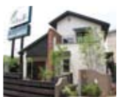
引野展示場 モデルハウス

注文建築とリフォームの実績をもつさくら建設が、 その企画力とノウハウを活かした ワンランク上の提案をいたします。